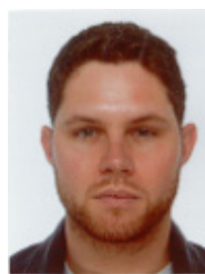
Pierre De COURCEL