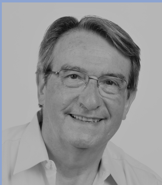
par Michel TERNISIEN Économiste et auteur

La logique voudrait qu'une entreprise ayant de bonnes performances financières bénéficie par ailleurs d'une bonne valorisation de ses actifs. Cette affirmation de bon sens peut-elle se vérifier et est-elle dans tous les cas fondée ? Ne peut-il y avoir une discordance entre performances et valorisation ?